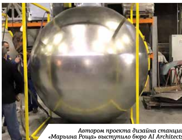
Автором проекта дизайна станции «Марьино Роцца» выступило бюро AI Architects

По словам главного архитектора столицы Сергея Кузнецова, для архитектуры московского метро эстетика важна, так как это популяризирует и столичный метрополитен, и современную архитектуру Москвы в целом. Проекты победителей, как отметил Кузнецов, в этом году получились яркими, новаторскими, они доказывают, что город движется в правильном направлении. Главный архитектор уверен, что со временем новые станции попадут в туристические маршруты города.