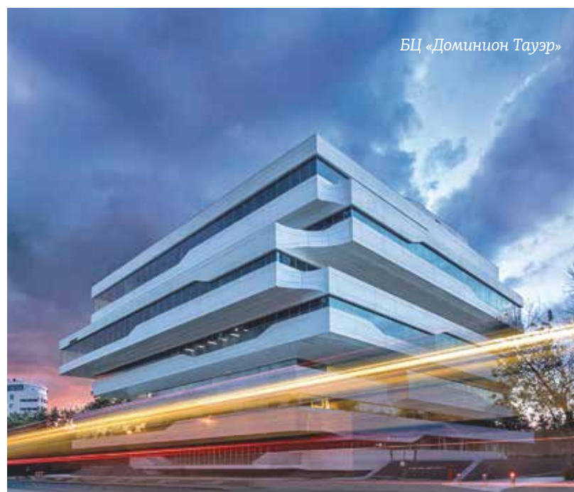
БЦ «Доминион Тауэр»

святила себя профессии. Сейчас бюро Zaha Hadid Architects руководит Патрик Шумахер. Он работал над ключевыми проектами студии с 1988 года. Под руководством Шумахера будет создан еще один московский проект – дизайн станции метро «Кленовый бульвар». Станция в футуристическом стиле, легкие плавные формы вестибюля и платформы «расчерчены» световыми линиями, входную группу выполняют из стекла и бетона – узнаваемый стиль Захи Хадид.