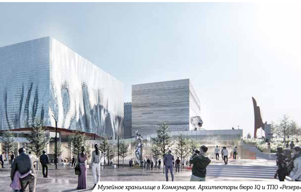
Музейное хранилище в Коммунарке. Архитекторы бюро IQ и ТПО «Резерв»

Знаменательная дата в жизни бюро – повод для новых планов и оценки пройденного