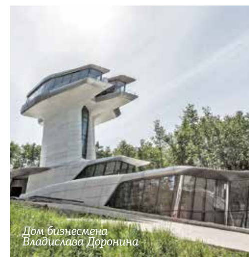
Дом бизнесмена Владислава Доронина