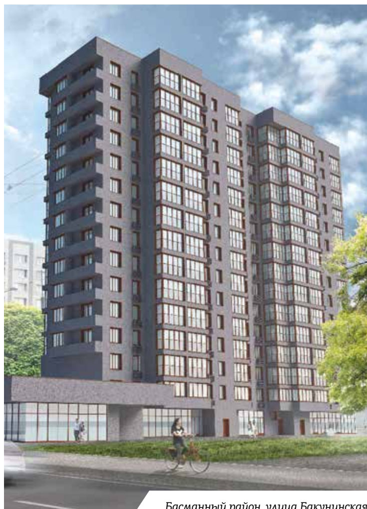
Басманный район, улица Бакунинская

Иначе решен внешний облик жилого пятисекционного многоквартирного дома в Люблине, на улице Краснодарской. В его отделке применяют фасадную плитку «под кир-