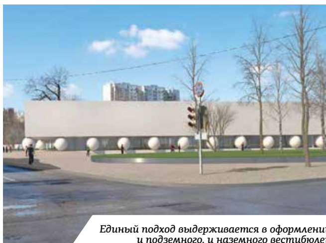
Единый подход выдерживается в оформлении и подземного, и наземного вестибюлей