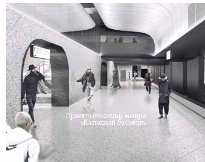
Проект станции метро «Кленовый бульвар»