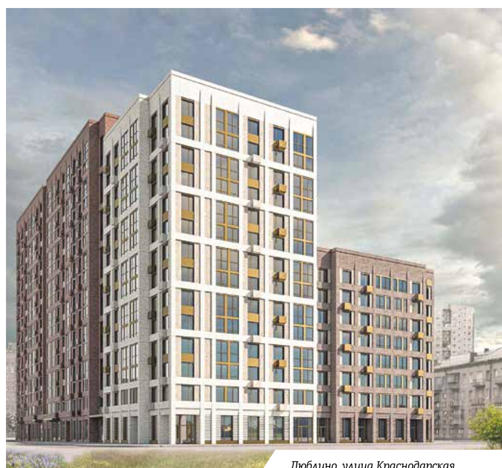
Люблино, улица Краснодарская

В Перове Москомархитектура согласовала проект стартового дома на 158 квартир. Этот район за счет программы реновации будет перестраиваться довольно существенно. И конечно, приобретет совершенно новый вид. Освоение этого района велось в советские годы за счет строительства хрущевок. Стартовые объекты программы реновации зададут новые акценты и стиль района. Так, например, декор фасадов нового дома также связан с имитацией кирпичной кладки, но на этот раз – серого цвета. Внешняя композиция двухсекционного жилого дома на улице Metallургов будет иметь членение фрагментами двух цветов, разделенными вставками серого цвета между этажами. Фасады облицуют панелями светло-серого цвета и «под кирпич».