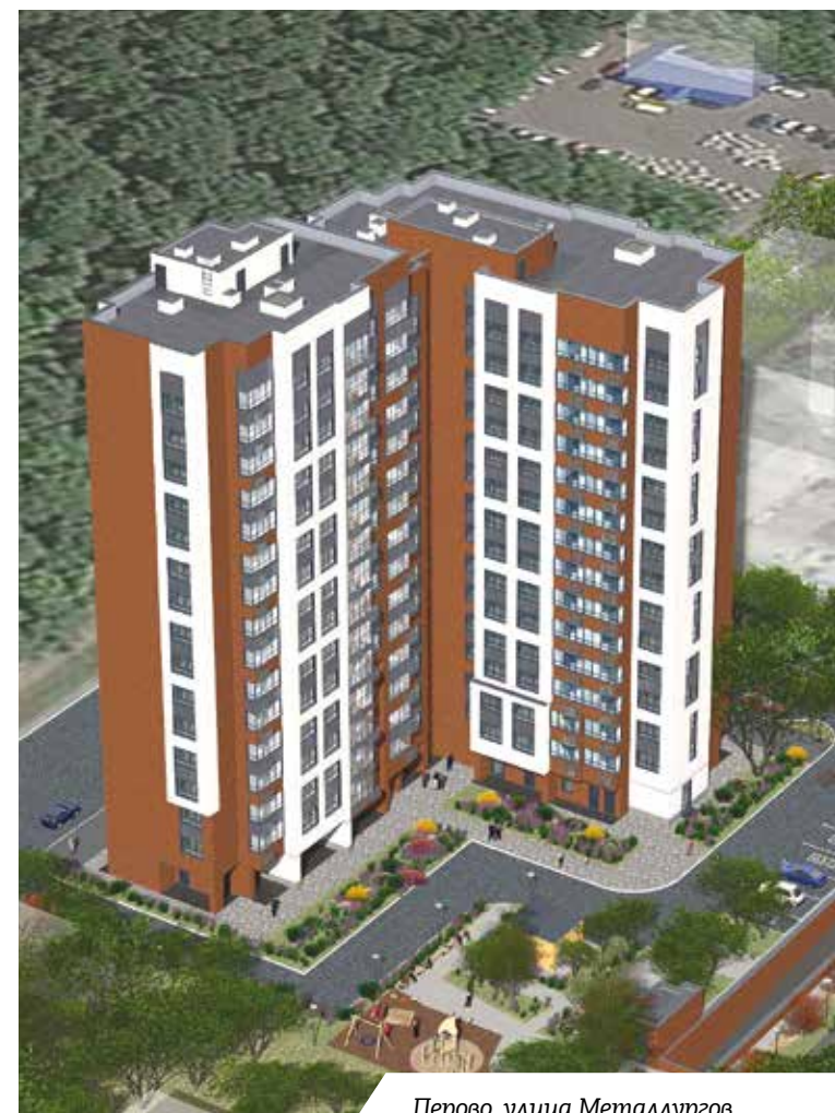
Перово, улица Metallургов

пич» и декоративные панели светлого оттенка. Как рассказал Сергей Кузнецов, для создания единого образа в облицовке первых двух этажей также решено использовать кирпичную кладку, которая «наслаивается» по периметру окон и входных групп. Интересная деталь: и в этом, и в других проектах архитекторы учли, что качество фасада не должно страдать от наличия кондиционеров. На этом объекте корзины под сплит-системы изготовят из металлического перфорированного листа, что внесет свои оттенки во внешний вид здания, общая площадь которого составит 39 тыс. кв. метров.