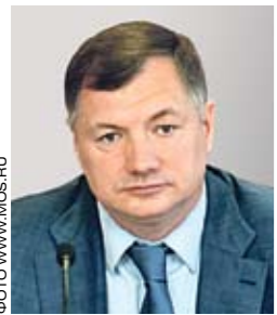
Марат Хуснуллин, заместитель мэра Москвы по вопросам градостроительной политики и строительства города Москвы:

— На территории Юго-Восточного административного округа реализуется программа реновации промышленно-коммунальных зон. Основные работы ведутся в рамках реорганизации промзоны «Серп и Молот». Долгие годы эта территория фактически была заброшенной: производственные мощности завода значительно сокращены, а часть существующих зданий пустует. Промзона будет превращена в новый комфортный городской район. Принято решение о строительстве здесь 2 млн кв. метров недвижимости, где смогут проживать 20 тыс. человек и будет создано 15–16 тыс. рабочих мест. Кроме жилья здесь возведут общественно-деловой центр площадью 172 тыс. кв. метров, детские сады на 1030 детей, школы на 2360 мест, поликлинику для взрослых и детей и автомобильные парковки на 9,5 тыс. машино-мест. То есть масштабы сопоставимы со среднестатистическим российским городом. В настоящее время инвесторы уже приступили к проектированию жилых комплексов и других объектов.