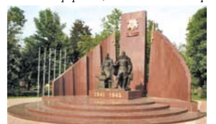
Лефортово, сквер Пруд-Ключики