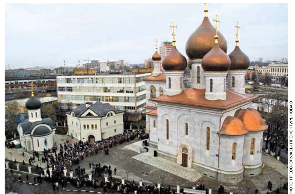
Храмовый комплекс преподобного Сергия Радонежского на Рязанке

В течение нескольких лет храмы расписывали и украшали. Так, при росписи стен Сведенской церкви художники – выпускники Суриковского училища – взяли за образец Успенский собор Московского Кремля.