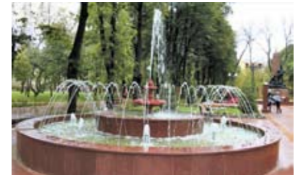
Лефортово, Госпитальный сквер