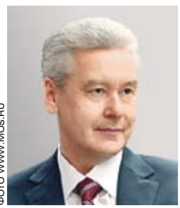
Сергей Собянин, мэр Москвы: