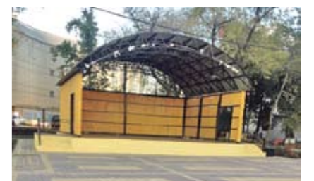
Сквер у Театра им. Г. Чихачёва, ул. 1-я Новокосыминская, д. 1

Мы всегда рады новым контактам и готовы к сотрудничеству!