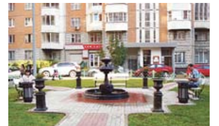
Дворы Лефортово, ул. Авиамоторная, д. 4, д. 11