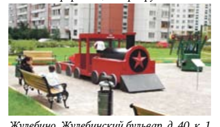
Жулебино, Жулебинский бульвар, д. 40, к. 1